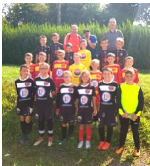
3 équipes U11 du club lors du tournoi

Samedi 7 septembre a eu lieu le tournoi du Racing Cast Porzay pour les U11 et U13. Plus de 250 enfants étaient présents.